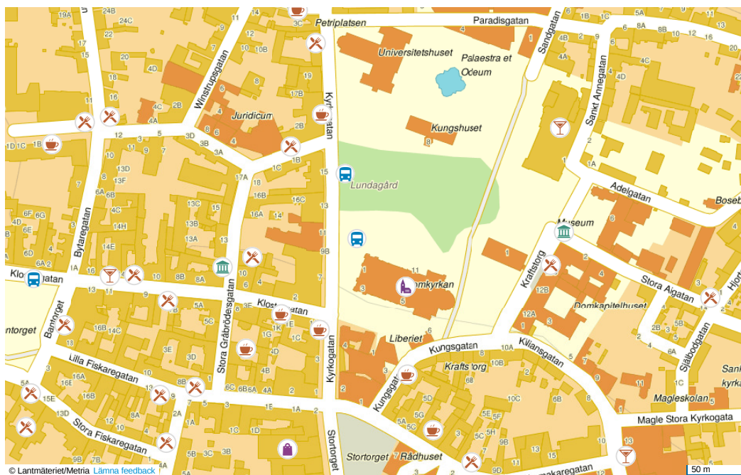
Figur 2: Centrala Lund med domkyrkan

Albert & Jakobies stora verk innehåller många uveitkapitel, vilka är lika heltäckande som Peposes och ibland till och med mer djuplodande (ofta av samme författare som i Pepose bok). Det är troligt att ni på kliniken har antingen Pepose, Nussenblatt eller Albert & Jakobies verk i biblioteket. Zierhuts tjocka bok utkom 2016 och kan sägas vara en uppdaterad men förkortad version av Pepose stora verk.